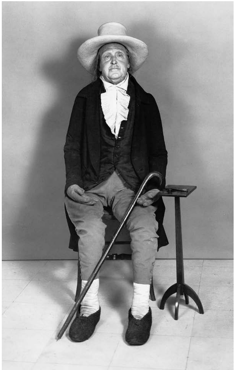
Abb. 1 Nützlich bis über den Tod hinaus: Jeremy Benthams «Auto-Icon» im University College in London.